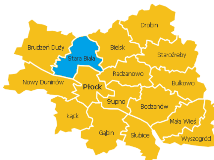
Rysunek 1. Gmina Stara Biała w powiecie płockim