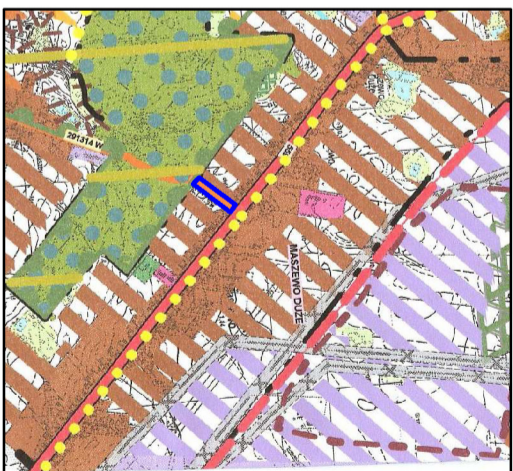
- zakres planu

- tereny potencjalnego rozwoju o dominacji funkcji mieszkaniowo - usługowej