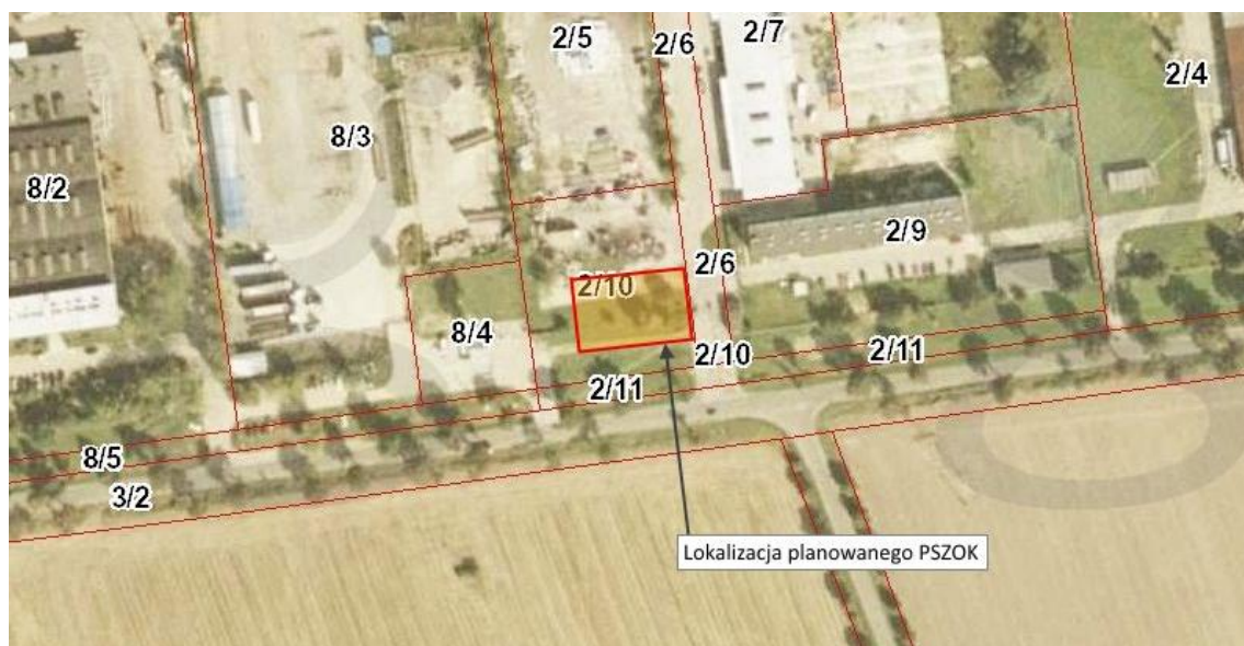
Ryc. 1. Lokalizacja planowanego przedsięwzięcia na terenie gminy