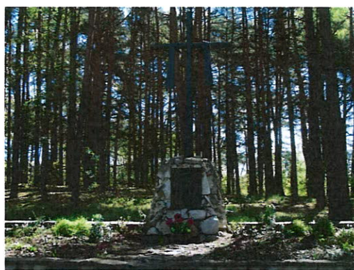
Miejsce pamięci narodowej w lasach brwileńskich.

Przez teren gminy przebiega szlak turystyczny nr 1a – Czerwony - im. Bolesława Krzywoustego /odcinek północny/.