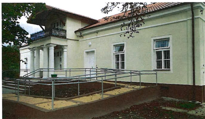
Dworek w Nowych Proboszczewicach, obecnie Ośrodek Zdrowia.

Pozostałe obiekty kulturowo-zabytkowe to: