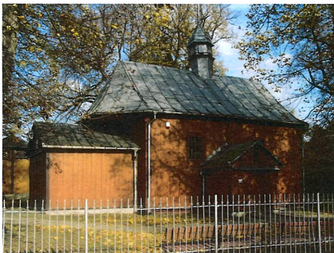
Kościół pw. św. Andrzeja z 1710 r. w Brwilnie.

Na przykościelnym cmentarzu znajduje się drewniana XVIII-wieczna dzwonnica i pomnik upamiętniający 34 mieszkańców Brwilna, którzy zginęli pomordowani przez hitlerowców w obozach koncentracyjnych.