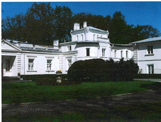
Pałac w Srebrnej.