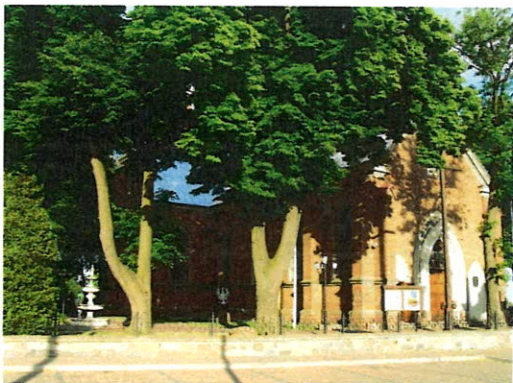
Kościół pw. św. Jadwigi Śląskiej w Starej Białej.