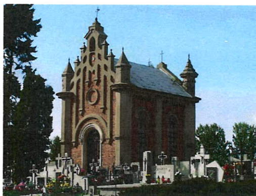
Kaplica cmentarna w Starych Proboszczewicach.

Spośród pięciu potwierdzonych źródłowo dworów, na terenie gminy zachowały się trzy: Srebrna, Ogorzelice i Nowe Proboszczewice. Po jednym z nieistniejących w Bronowie-Zalesiu pozostały jedynie resztki parku. W bardzo dobrym stanie zachowany jest pałac w Srebrnej, pozostałe utrzymane są w gorszym, ale zadawalającym stanie.