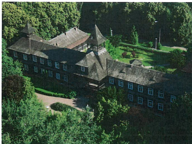
„Antoniówka” w Brwilnie - obecnie Dom Pomocy Społecznej.