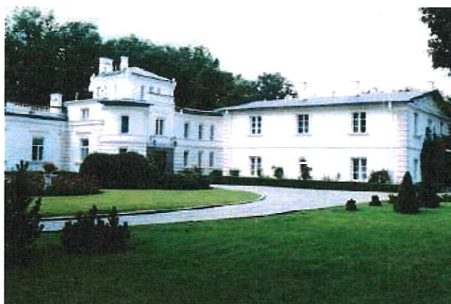
Pałac w Srebrnej od strony dziedzińca.