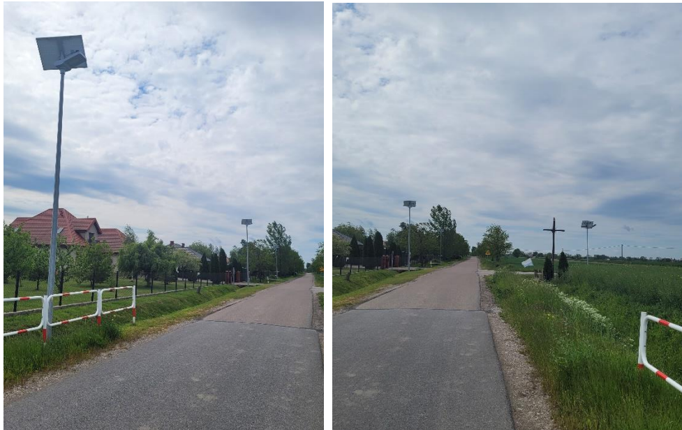
Oświetlenie uliczne solarne w miejscowości Kamionki

Na terenie Gminy zlokalizowano około 23,302 km chodników oraz 3,52 km ścieżek pieszo-rowerowych. Długość ścieżek w poszczególnych Sołectwach Gminy przedstawionych jest w tabeli 9.