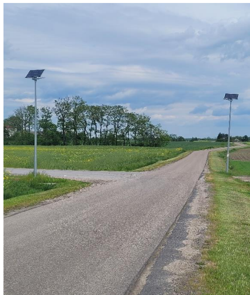
Oświetlenie uliczne solarne w miejscowości Miłodróż