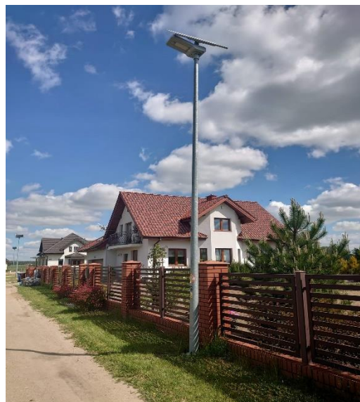
Oświetlenie uliczne solarne w miejscowości Nowe Proboszczewice ul. Ułańska