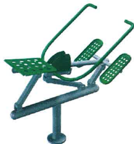
Proponowany wzór urządzenia