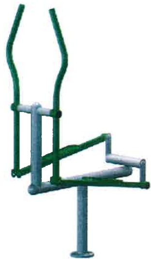
Proponowany wzór urządzenia