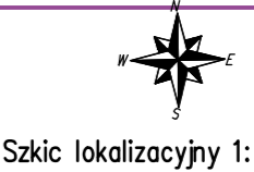
Szkic lokalizacyjny 1:25 000