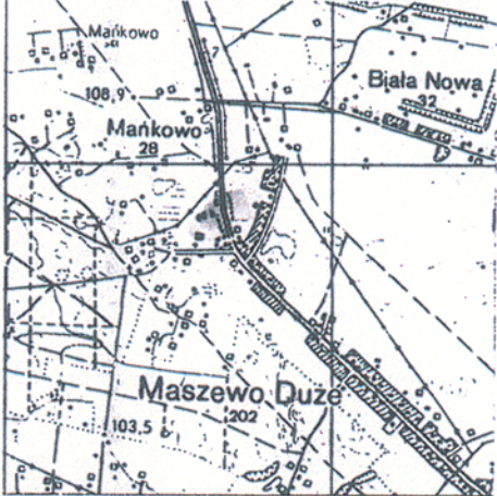
ORIENTACJA 1: 50 000

kopia mapy sytuacyjno-wysokościowej arkusz nr 251.444.181 i 183