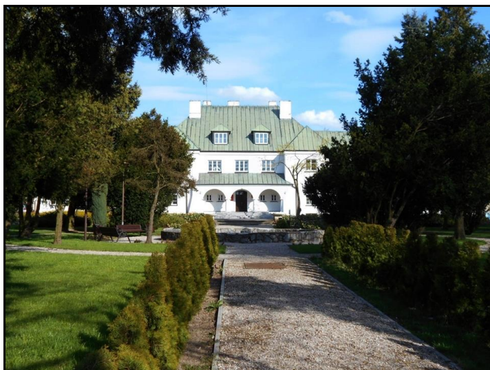
Fot. 1. Budynek szkoły wraz z otaczającym drzewostanem w Nowym Trzepowie, wpisane do rejestru zabytków rej. nr 501 z dnia 01.06.1979 r.