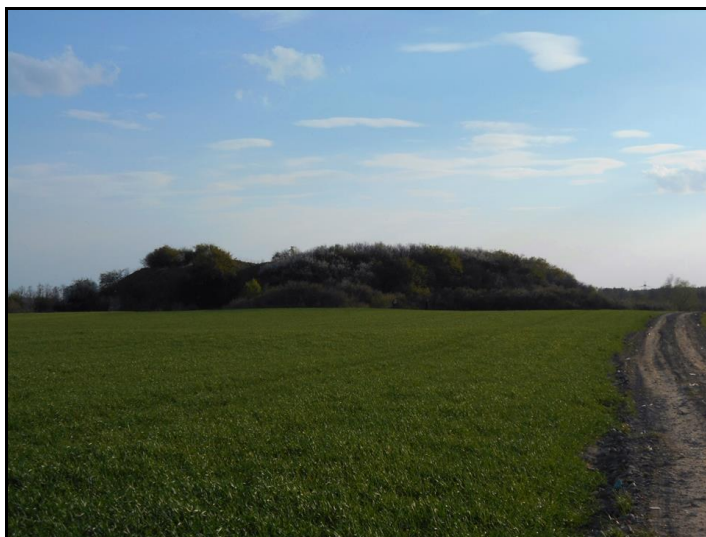
Fot. 6. Grodzisko w Nowych Proboszczewicach, wpisane do rejestru zabytków rej. nr 425/777 W z dnia 01.07.1968 r.