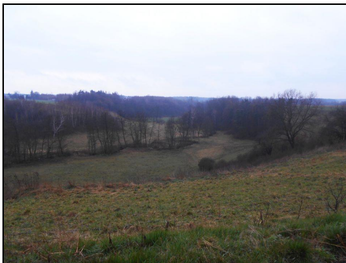
Fot. 8. Dolina rzeki Wierzbicy w Kobiernikach.