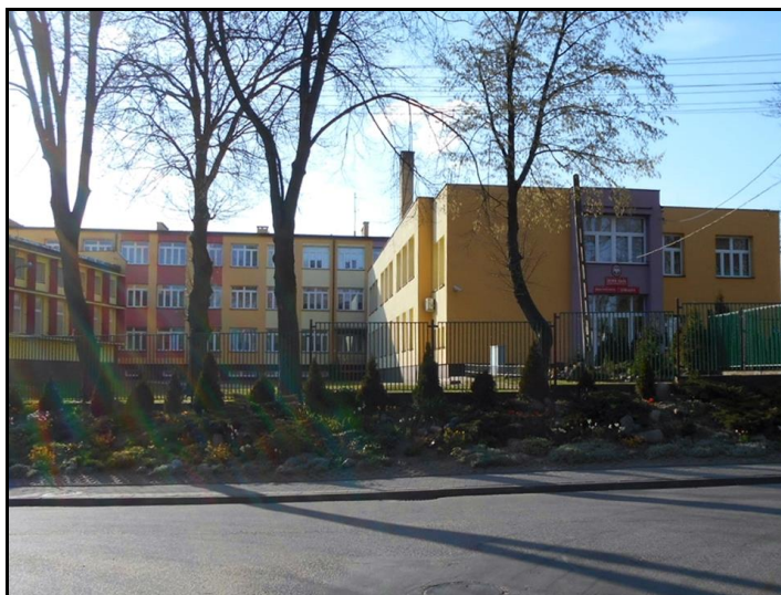
Fot. 10. Budynek Zespołu Szkół w Maszewie Dużym.