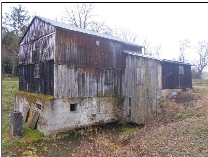
Fot. 9. Młyn wodny w Kobiernikach, wpisany do Gminnej Ewidencji Zabytków.