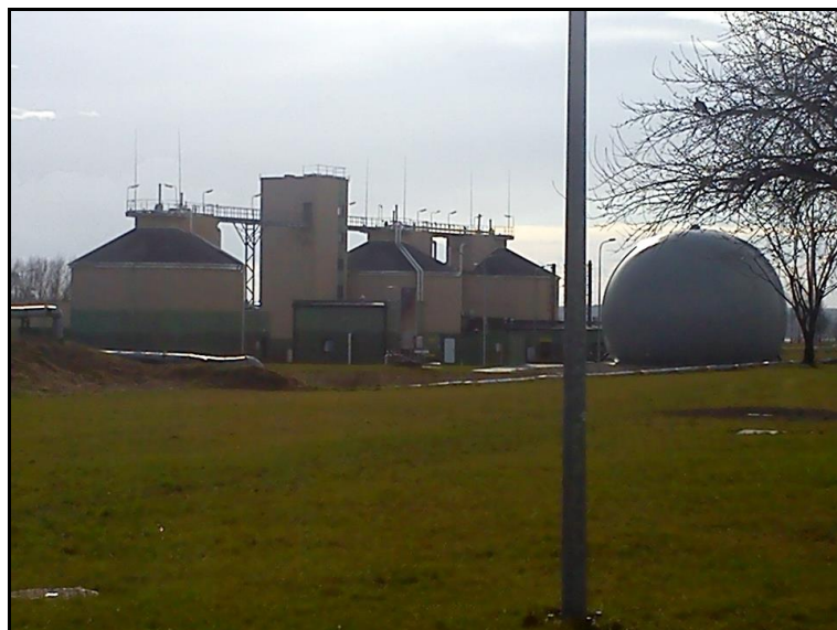
Fot. 14. Oczyszczalnia ścieków w Maszewie.

W Koncepcji spójnej gospodarki wodno-ściekowej dla Obszaru Funkcjonalnego Aglomeracji Płockiej (projekt, 2015 r.) przewidziano realizację projektu „Kompleksowa gospodarka wodno-ściekowa na terenach OFAP o rozproszonej zabudowie” w ramach którego realizowana ma być „budowa przydomowych oczyszczalni ścieków”.