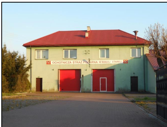
Fot. 13. Budynek Ochotniczej Straży Pożarnej w Starej Białej.

Jednostka w Starej Białej włączona jest do Krajowego Systemu Ratownictwa Gaśniczego. Wszystkie jednostki wyposażone są w podstawowy sprzęt ratowniczo-gaśniczy.