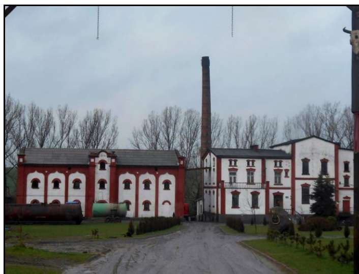
Fot. 5. Gorzelnia oraz spichlerz w Srebrnej, wpisany do rejestru zabytków rej. nr 230/1435/75 W z dnia 22.05.1978 r.