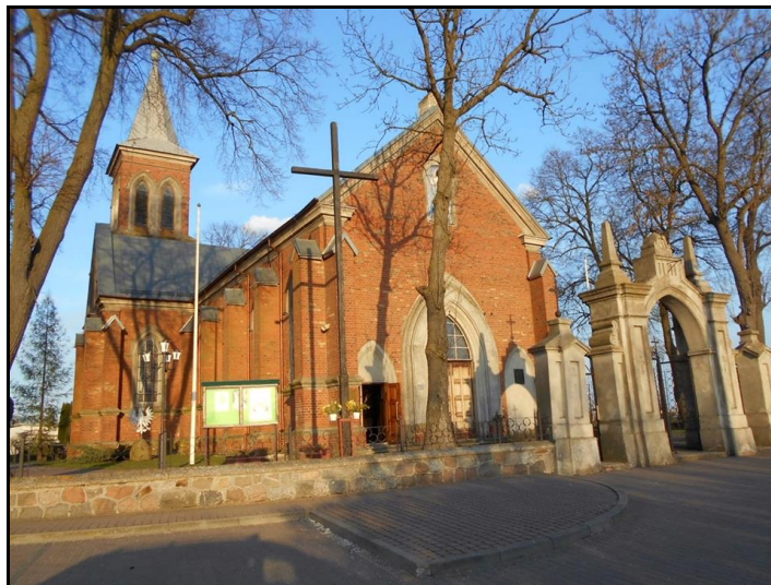
Fot. 3. Kościół parafialny św. Jadwigi w Starej Białej, wpisany do rejestru zabytków rej. nr 440 z dnia 13.03.1978 r.

Źródło: opracowanie własne na podstawie Rejestru Gminnej Ewidencji Zabytków.