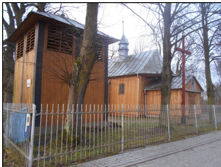
Fot. 2. Kościół parafialny św. Andrzeja Apostoła i dzwonnica w Brwilnie, wpisane do rejestru zabytków rej. nr 132/542/62 z dnia 30.03.1962 r.