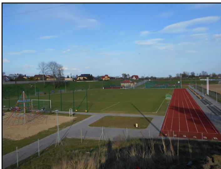
Fot. 12. Centrum Sportu „Wierzbica” w Nowych Proboszczewicach.

Na terenie Gminy zlokalizowane są także tereny służące lub mogące służyć jako rekreacyjno-sportowe, nie zostały one jednak w pełni zagospodarowane i doposażone do współczesnych standardów np. boisko przy Instytucie Nauk Ekonomicznych i Informatyki w Nowym Trzepowie, czy boisko w Bronowie-Zalesiu.