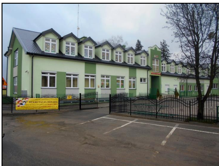
Fot. 11. Budynek Zespołu Szkolno-Przedszkolnego w Wyszyńcu.

W gminie Stara Biała brak jest szkół takich jak licea, technika czy szkoły zawodowe. Uczniowie korzystają z placówek zlokalizowanych w pobliskich miastach, czyli przede wszystkim w Płocku.