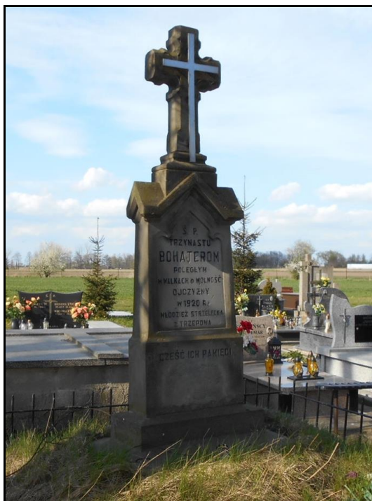
Fot. 7. Mogiła 13 żołnierzy poległych w Niegłosach w 1920 r.